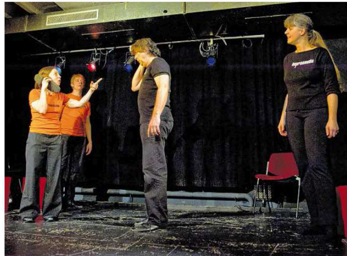
Immer neu: Das Stück verläuft nach Stichwörtern der Zuschauer.